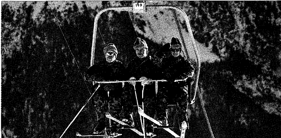
Schweizer Soldaten sind anders: Sie bewahren nicht nur ihre Waffen zu Hause auf, sie trainieren auch viel auf Skiern.